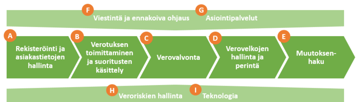
Kuva 1. Veroviranomaisen toiminnan yleinen viitekehys.

Toiminnan tuloksellisuutta kuvataan seuraavassa osa-alueittain OECD:n veroviranomaisen toiminnan yleisen viitekehyksen mukaan jaoteltuna (Kuva 1). Kirjaimilla merkittyjen osa-alueiden jälkeen kuvataan omassa kappaleessaan Verohallinnon kansainvälisen toiminnan tuloksellisuutta. Veronsaajien oikeudenvilvontayksikön ja Tulorekisteriyksikön toimintaa kuvataan kappaleessa 1.5.2 Palvelukyky sekä suoritteiden ja julkishyödykkeiden laatu .